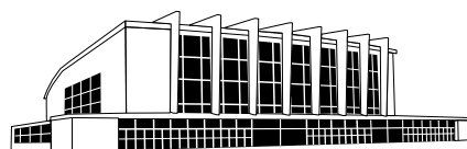
UB 1 Stadthalle am Alten Messplatz