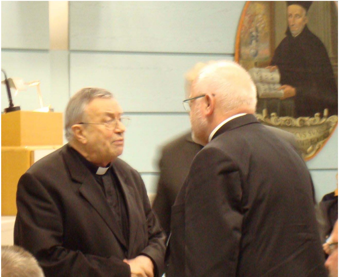
Karl Kardinal Lehmann mit Erzbischof Reinhard Marx