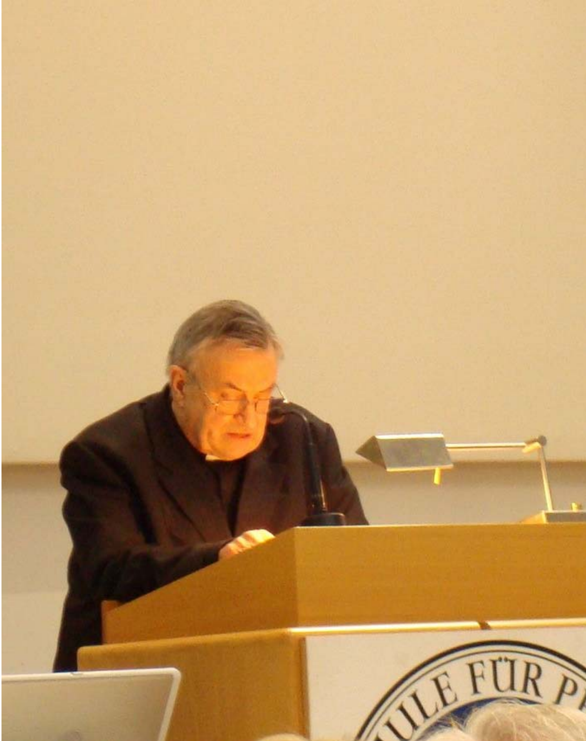
Karl Kardinal Lehmann bei seinem Vortrag