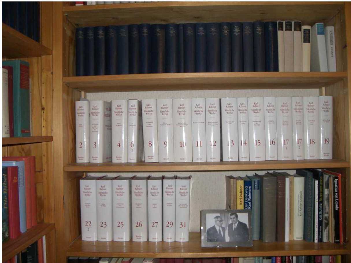
Karl Rahner – Sämtliche Werke – Stand Frühjahr 2009 1